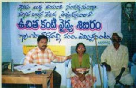
జమ్మికుంటలో మా.వి.వే. ఉచిత వైద్య శిబిరం (25-5-2005)