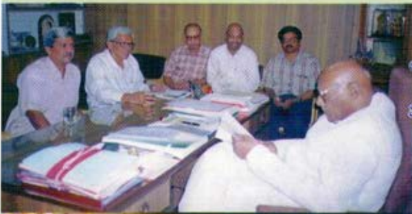
వాస్తుపేరుతో జరిగే ప్రజాధన దుర్వినియోగాన్ని ఆపేలా చర్యలు తీసుకోవాలని కోరుతూ నాటి అర్ధికమంత్రి కె.రోశయ్యగారికి చినతిపత్రం సమర్పణ (13-6-2009)