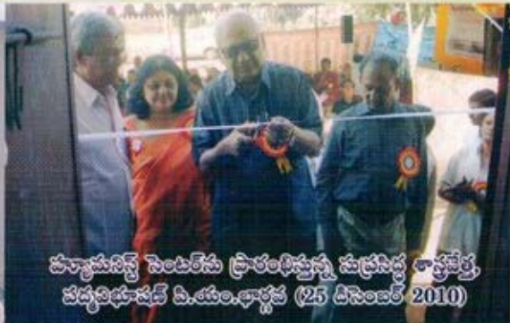
హ్యూమనిస్ట్ సెంటర్ను ప్రారంభిస్తున్న సుప్రసిద్ధ తాత్వజ్ఞ, వద్యవిభాషణ్ పి.యం.భార్గవ (25 డిసెంబర్ 2010)