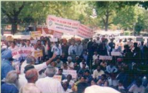
రాజ్యం నుండి మతాన్ని వేరు చేయాలన్న డిమాండ్తో, ఢిల్లీలో ఫిరా నిర్వహించిన జాతీయ ధర్మా శార్వక్రమంలో మా.వి.వే.