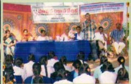
గణిత ప్రతిభా పరీక్షల బహుమతి ప్రధానోత్సవం (అదిలాబాద్ జిల్లా 4-10-2006)